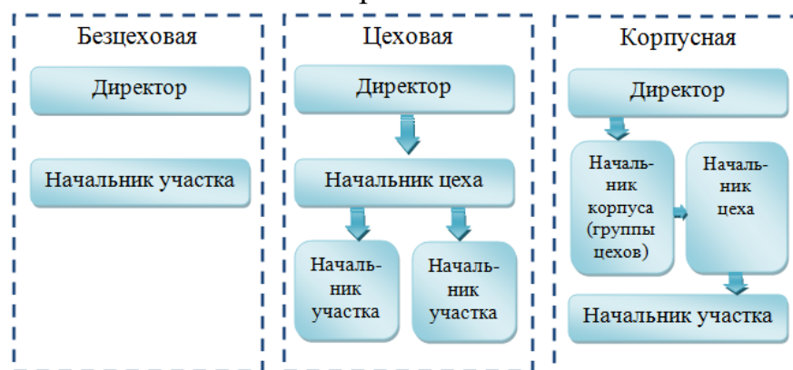
Схема зависимости управленческой структуры от специализации работы

Цифровые данные в таблицах пишутся строго по классам и разрядам чисел (единицы под единицами, десятки под десятками и т.д.).