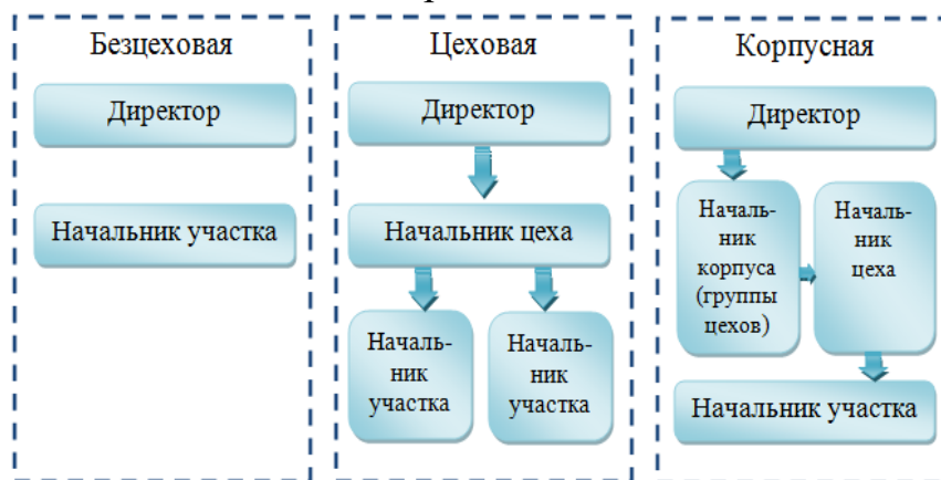
Схема зависимости управленческой структуры от специализации работы

Цифровые данные в таблицах пишутся строго по классам и разрядам чисел (единицы под единицами, десятки под десятками и т.д.).