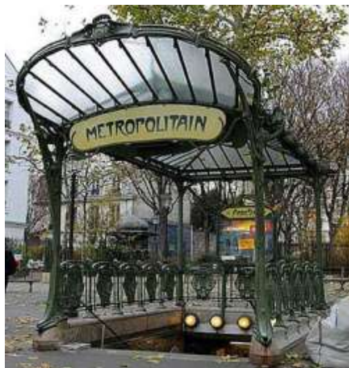
Эктор Гимар «Павильон метро в Париже» Модерн. 1900г.