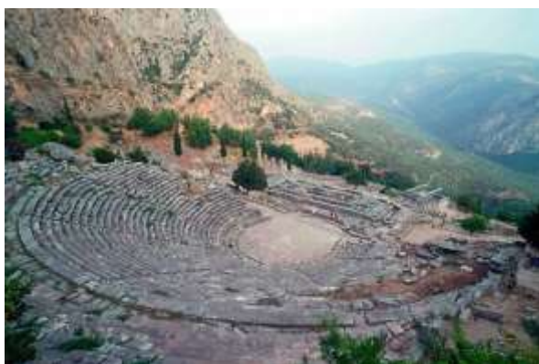
Театр в Дельфах IV в.до н.э.