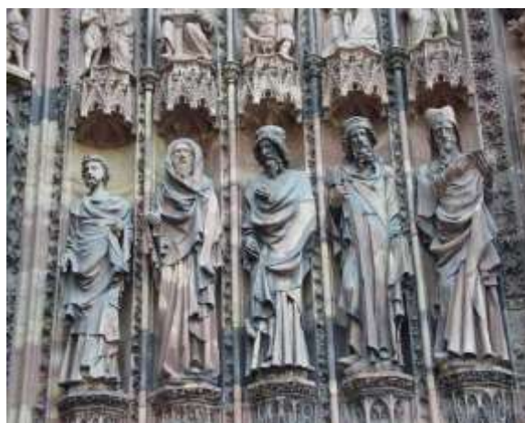
Страсбургский собор во Франции.. Эпоха высокой готики. Зодчий Эрвин фон Штайнбах, который создал в 1284 году западный фасад собора.