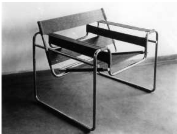
Морсель Бройер «Кресло Василий» БАУХАУЗ 1925 г.