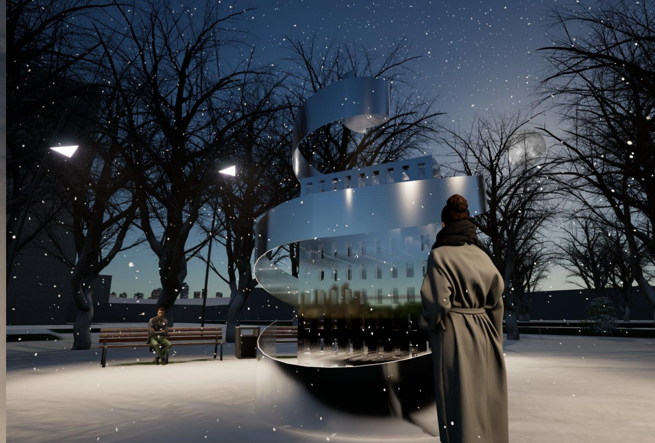
Стелла 1 Материал: хром